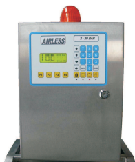
Cuadro de control de fácil e intuitivo manejo para la regulación de la presión desde el propio teclado. Luz intermitente de advertencia para situaciones de emergencia