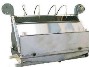
Disponemos de cabinas en acero inoxidable para la colocación de las boquillas